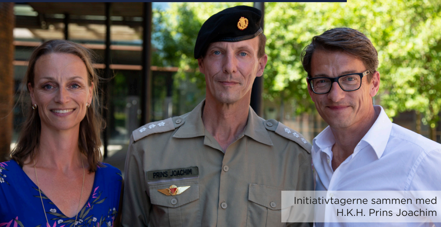
Initiativtagerne sammen med H.K.H. Prins Joachim